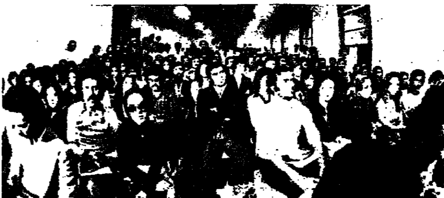
جانب من الجمهور الذي استمع

الغلاء كان موضوع الحديث الذي ألقاه رئيس الحكومة الدكتور سليم الحص مساء أمس في كلية الحقوق والمعلوم الاقتصادية والسياسية (المنتاج). وقد تصدى الرئيس الحص للتوضيح بروح علمية دون أن يغفل مسؤولية الحكم، فمدد الأسباب وحرص للحلول، مؤكدا على أن «الغلاء جزء من الزمن الذي يجب أن نغفقه بمدد الضعة التي عصفت ببلدنا».